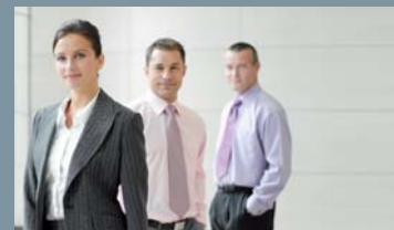
Sales & Customer Care