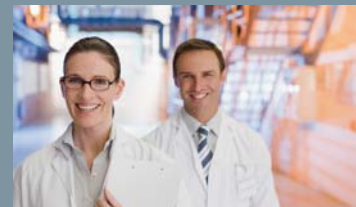
Engineering & Industrial Services